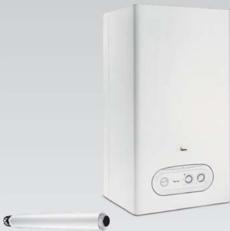
دودکش دوجداره مخصوص